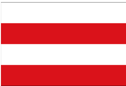
Põhja-Sakala valla lipp

Põhja-Sakala valla lipp koosneb kahest valgest ja kahest punasest vaheldumisi asetsevast võrdsest laiust. Vapp - punasel kilbil on põigiti hõbedane sõjasarv kuldsete kandevõrude, -keti ja huulikuga, selle peal on püstiasetsev hõbedase tera ning kuldse käepidemega mõök.