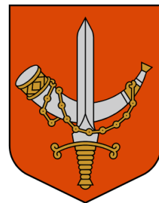
Põhja-Sakala valla vapp